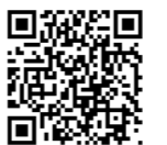
金春円満井会ホームページ

東京都中央区銀座8-8-19 伊勢由ビル2階ギャラリー 電話03-3571-5388 (伊勢由)